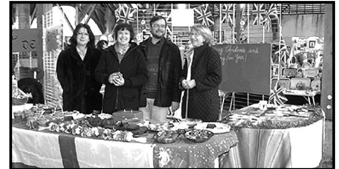
Décembre 2007 : Marché de Noël - Halles du Pellerin.