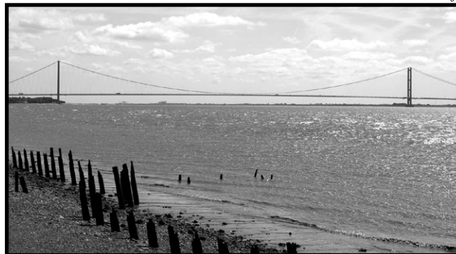
Le Humber Bridge.

North Ferriby est un village de 3600 habitants, situé dans le nord-est de l'Angleterre. Il se trouve dans le comté du Yorkshire-Humberside, près de Hull, Leeds et York, à 300 kms de Londres. Comme Le Pellerin, il borde un fleuve, le Humber, et a beaucoup de similitudes avec notre commune.