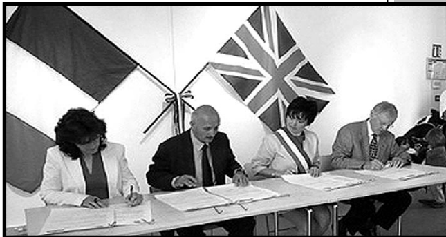
7 juin 2008 : signature du Pacte de l'Amitié - Médiathèque George Sand, Le Pellerin.